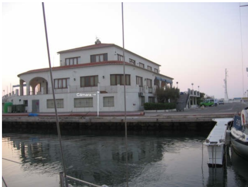
Ejemplo de control de una determinada zona del muelle

Para almacenar y transmitir imágenes a través de una red los datos deben estar comprimidos o consumirán mucho espacio en disco o mucho ancho de banda. Si el ancho de banda está limitado la cantidad de información que se envía debe ser reducida rebajando el número de frames por segundo o aceptando un nivel de calidad inferior. Existen múltiples estándares de compresión que resuelven los problemas de número de frames por segundo y calidad de imagen de diferentes formas. De los estándares más comunes tanto el JPEG como el MPEG transmiten vídeo de alta calidad.