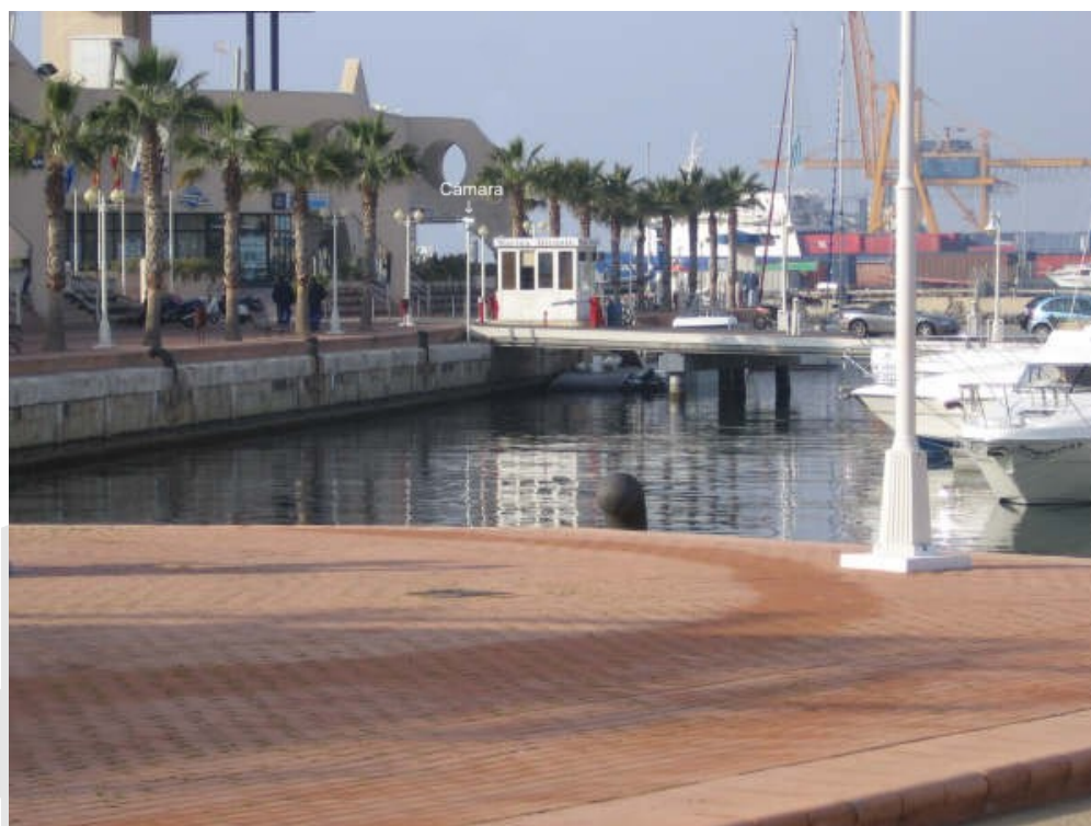
Ejemplo de control de acceso a un puerto deportivo